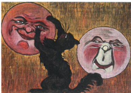
Théophile Alexandre Steinlen (1859-1923), Une frise de chats et de lunes , 1885, collection Weisman & Michel.