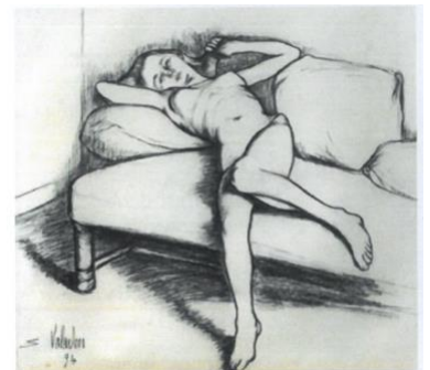
Suzanne Valadon, (1865-1938), Femme nue allongée sur un canapé , 1894, collection musée Toulouse Lautrec.

Le prêt de cette collection offre au musée Toulouse-Lautrec l'opportunité d'un exquis dialogue avec son propre fonds d'artistes amis ou contemporains d'Henri de Toulouse-Lautrec.