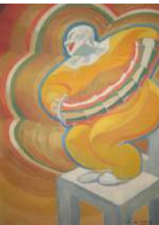
H.G. Ibels, Le Clown au bandonion , vers 1924, huile sur toile marouflée sur carton

Une découverte ludique et sonore de l'exposition temporaire pour les tout-petits.