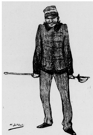
Henri-Gabriel IBELS, Le Sifflet , 17 février 1898, première de couverture du n°1, 40,5x32 cm, Paris, Bibliothèque nationale de France

Journée organisée avec le soutien de la Société des amis du musée Toulouse-Lautrec